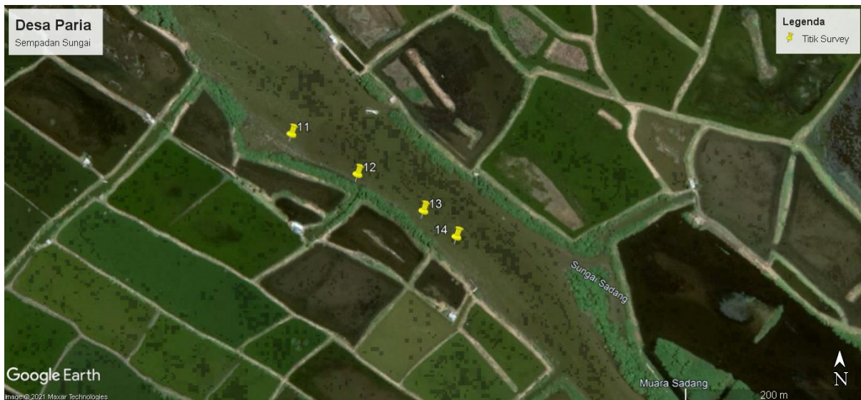
(Gambar 6. Peta Titik Survey Kawasan Muara Penanaman Mangrove Desa Paria)

Pengukuran pertama dilakukan pada pagi hingga sore hari untuk melihat pasang tertinggi air laut, kawasan pesisir yang terdapat di desa paria sangat berpengaruh dengan pasang surut, sehingga data kedalaman yang didapatkan bervariasi di masing-masing titik survey, bukan hanya kawasan pesisir namun kawasan muara sungai juga terkena pengaruh pasang surut. Selain itu, sungai ini juga dimanfaatkan sebagai jalur lalu lintas kapal, sehingga kawasan yang ditetapkan berapa pada jalur yang tidak dilalui kapal warga.