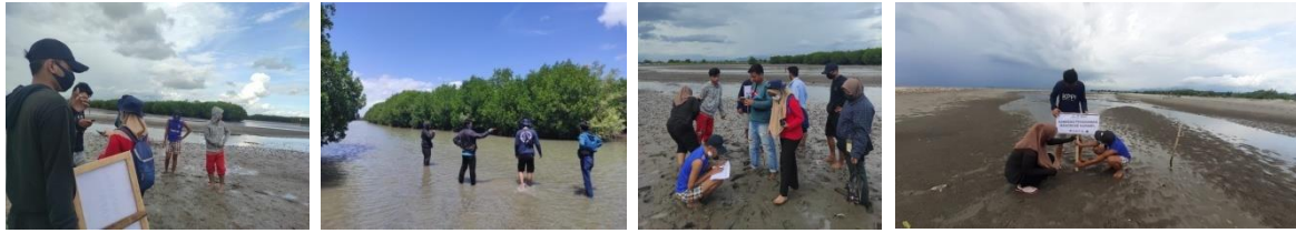
(Gambar 4. Kegiatan Survey Parameter Lingkungan Desa Bababinanga)