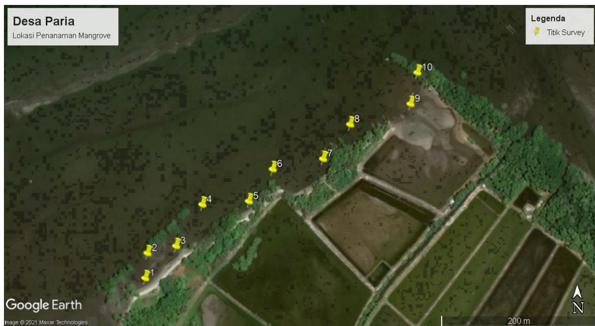
(Gambar 5. Peta Titik Survey Kawasan Pesisir Penanaman Mangrove Desa Desa Paria)

Lokasi kegiatan survey yang dilaksanakan dikawasan pesisir Desa Paria. Panjang kawasan penanaman yang telah di survey dikawasan pesisir adalah 450 meter, sedangkan dikawasan muara adalah 221 meter Berikut ini peta sebaran titik survey kawasan penanaman mangrove yang dilakukan di Desa Paria :