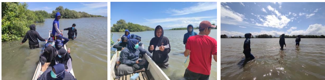
(Gambar 7. Kegiatan Survey Parameter Lingkungan Desa Paria)

Kawasan muara juga memiliki riwayat bakau yang dibibitkan sehingga tingkat kesesuaian kawasan berdasarkan riwayat sangat baik (Moderat). Selain itu, kawasan ini juga dijadikan sebagai kawasan penanaman dari BPDAS maupu Pemerintah Provinsi (DKP).