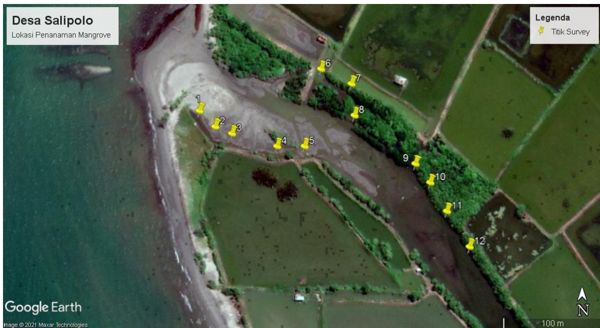
(Gambar 1. Peta Titik Survey Kawasan Penanaman Mangrove Desa Salipolo)

Lokasi kegiatan survey yang dilaksanakan dikawasan pesisir dan bantaran muara sungai desa salipolo. Panjang kawasan penanaman yang telah di survey dikawasan pesisir adalah 196 meter, sedangkan panjang kawasan penanaman mangrove di muara sungai adalah 189 meter. Berikut ini peta sebaran titik survey kawasan penanaman mangrove yang dilakukan di Desa Salipolo :