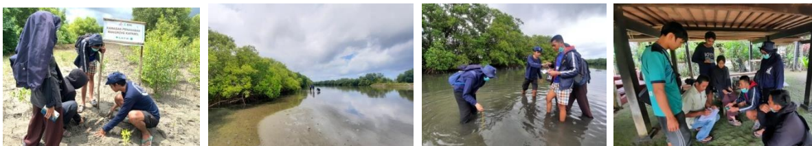
(Gambar 2. Kegiatan Survey Parameter Lingkungan Desa Salipolo)

Pengukuran pertama dilakukan pada pagi hari untuk melihat pasang tertinggi air laut maupun muara sungai, namun berdasarkan pengamatan kawasan penanaman mangrove pada bulan Agustus 2021 tidak terkena dampak pasang tertinggi sehingga kawasan tetap kering, berbeda dengan kawasan yang terdapat pada muara sungai, kawasan tersebut memiliki genangan air dikarena muara sungai tertutup mati akibat sedimentasi sehingga tidak mengalami perubahan kenaikan air yang signifikan.