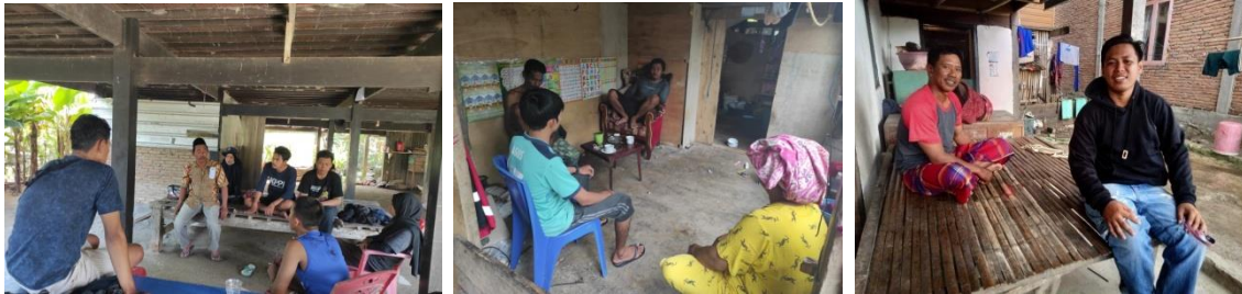
(Gambar 8. Wawancara dengan Masyarakat mengumpulkan informasi kawasan)

Menindaklanjuti saran dan masukan hasil rapat sehingga PMU Hilir bersama anggota KPPI melakukan wawancara mendalam kepada tokoh masyarakat maupun warga yang memiliki kawasan yang telah dilakukan survey parameter lingkungan. Selain itu, PMU juga melakukan pendataan untuk mengetahui pemilik kawasan yang telah disurvei untuk memastikan kawasan tersebut dapat dilakukan penanaman mangrove.