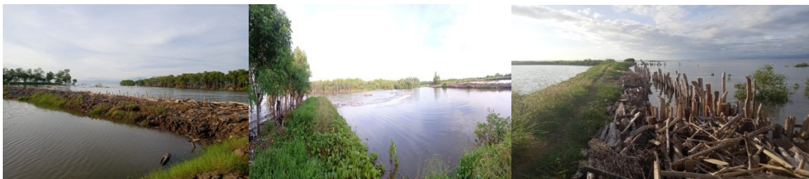
Titik Kordinat (X : 774489, Y : 9597496) (Dokumentasi Wilayah Pesisir terkena Abrasi Laut)

Observasi juga dilakukan di pesisir Desa Paria untuk melihat dampak abrasi yang terjadi di pesisir yang berdampak pada tambak masyarakat. Kelompok 3 menemukan titik abrasi di muara DAS Saddang, Untuk saat ini masyarakat melakukan upaya mitigasi dengan cara memasang balok-balok yang ditancapkan dan disusun untuk mencegah abrasi.