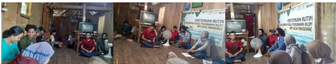
(Dokumentasi Pertemuan Rutin KPPI MAPIA di Desa Massewae)

Berdasarkan desain pertemuan rutin KPPI, setiap kelompok KPPI difasilitasi untuk mengumpulkan informasi Komoditas secara mendalam yang akan dilaksanakan dengan metode wawancara Kuisisioner, melakukan survey titik rawan bencana dan menyusun rencana aksi yang akan didiskusikan dengan BPDB Kab. Pinrang dan melaksanakan rencana aksi jangka pendek yang berkaitan dengan dampak perubahan iklim, berikut informasi yang didapatkan dari hasil pertemuan :