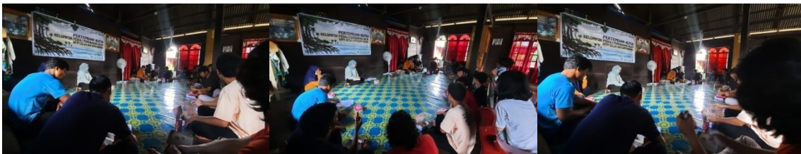
(Dokumentasi Pertemuan Rutin KPPI PPMDK di Desa Katomporang)

Berdasarkan desain pertemuan rutin KPPI, setiap kelompok KPPI difasilitasi untuk mengumpulkan informasi Komoditas secara mendalam yang akan dilaksanakan dengan metode wawancara Kuisisioner, melakukan survey titik rawan bencana dan menyusun rencana aksi yang akan didiskusikan dengan BPBD Kab. Pinrang dan melaksanakan rencana aksi jangka pendek yang berkaitan dengan dampak perubahan iklim, berikut informasi yang didapatkan dari hasil pertemuan :