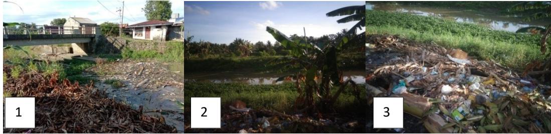
Titik Koordinat 1 (X : 776284, Y : 9593674), Titik Koordinat 2 (X : 775984, Y : 9593767), Titik Koordinat 3 (X : 775603, Y : 9594007) (Dokumentasi sampah di pinggir DAS Saddang Desa Paria)

Tumpukan sampah yang terdapat dipinggiran DAS Saddang ini merupakan sampah hasil buangan industri rumah tangga masyarakat. Masyarakat berdalih bahwa tidak adanya TPA atau lokasi pembuangan sampah yang fokus dalam satu tempat sehingga masyarakat memilih untuk membuang sampah dipinggiran sungai. Dibutuhkan upaya penyadaran untuk merubah kebiasaan masyarakat membuang sampah di pinggir DAS Saddang.