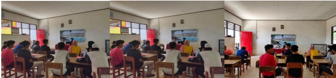
(Dokumentasi Pertemuan Rutin KPPI Binanga Saddang di Desa Bababinanga)

Berdasarkan desain pertemuan rutin KPPI, setiap kelompok KPPI difasilitasi untuk mengumpulkan informasi Komoditas secara mendalam yang akan dilaksanakan dengan metode wawancara Kuisisioner, melakukan survey titik rawan bencana dan menyusun rencana aksi yang akan didiskusikan dengan BPDB Kab. Pinrang dan melaksanakan rencana aksi jangka pendek yang berkaitan dengan dampak perubahan iklim, berikut informasi yang didapatkan dari hasil pertemuan :