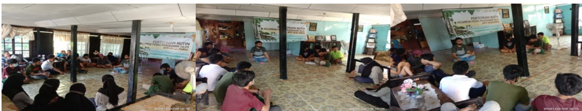
(Dokumentasi Pertemuan Rutin KPPI PARMA di Kantor Desa Paria)

Berdasarkan desain pertemuan rutin KPPI, setiap kelompok KPPI difasilitasi untuk mengumpulkan informasi Komoditas secara mendalam yang akan dilaksanakan dengan metode wawancara Kuisiner, melakukan survey titik rawan bencana dan menyusun rencana aksi yang akan didiskusikan dengan BPDB Kab. Pinrang dan melaksanakan rencana aksi jangka pendek yang berkaitan dengan dampak perubahan iklim, berikut informasi yang didapatkan dari hasil pertemuan :