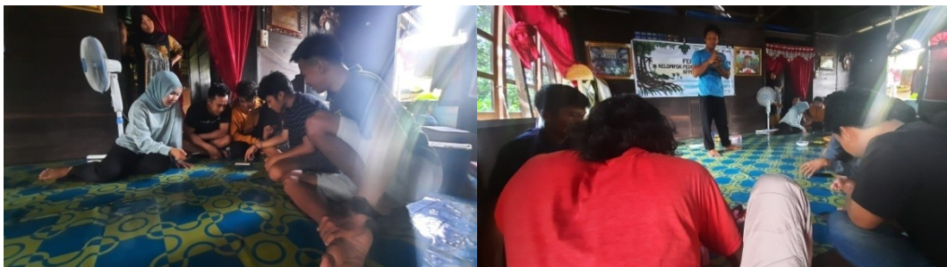
(Ketua KPPI PPMDK Desa Katomporang menjelaskan cara menggunakan GPS Essential)

Pertemuan rutin KPPI Desa Katomporang diawali dengan follow up hasil pelatihan Meta Fasilitasi dan Pendampingan KPPI oleh fasilitator untuk memastikan semua anggota KPPI memahami materi yang didapatkan oleh perwakilan KPPI yang diutus pada pelatihan yang dilaksanakan pada bulan Januari 2021. Hal ini penting dilakukan agar semua anggota KPPI memiliki pemahaman yang sama dalam mengumpulkan informasi nantinya.