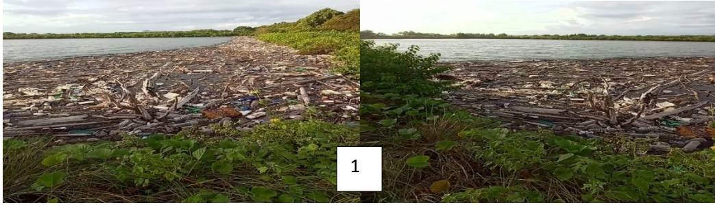
Titik Koordinat 1 ( X : 776359 Y : 9584159 ) (Dokumentasi sampah di tambak Masyarakat)

Masuknya sampah kedalam tambak sering dikeluhkan masyarakat di desa salipolo, hal ini dikarenakan akan mempengaruhi organisme yang hidup didalamnya. Lokasi tambak yang sangat dekat dengan pesisir ditambah pematang tambak yang rendah mengakibatkan sampah dari pesisir laut masuk kedalam tambak pada saat terjadi pasang air laut.