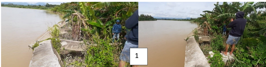
Titik Koordinat 1 (koordinat X : 781969, Y : 9587494) ( Dokumentasi pengambilan titik rawan di Pinggiran DAS Saddang )

Titik rawan yang ditemukan adalah keadaan pondasi beton tersebut sangatlah memprihatinkan karena keadannya sudah patah dan sebagiannya nyaris rubuh dan letak dipinggiran DAS Saddang sangat dekat dengan jalan poros dan persawahan.