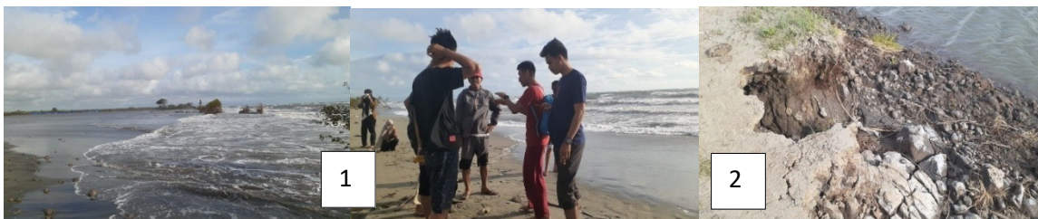
Titik koordinat 1 ( X : 773205 Y : 9587973), dan Titik Koordinat 2 ( X : 772638, Y : 9588936)

Abrasi pesisir di Desa Salipolo menyebabkan rusaknya pematang tambak masyarakat, Kondisi ini diperparah ketika dari dampak abrasi yang terjadi karena aktifitas pasang surut ombak dimana hal tersebut merusak pematang tambak masyarakat. Lahan tambak tersebut salah satu lahan yang dulunya ditumbuhi mangrove namun dialih fungsikan oleh masyarakat menjadi tambak. Selain itu, sudah tidak ada lagi tumbuhan mangrove yang melindungi kawasan tersebut.