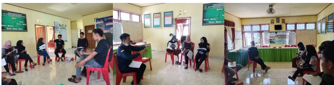
(Dokumentasi Pertemuan Rutin KPPI Biring Sadding di Kantor Desa Salipolo)

Berdasarkan desain pertemuan rutin KPPI, setiap kelompok KPPI difasilitasi untuk mengumpulkan informasi Komoditas secara mendalam yang akan dilaksanakan dengan metode wawancara Kuisisioner, melakukan survey titik rawan bencana dan menyusun rencana aksi yang akan didiskusikan dengan BPDB Kab. Pinrang dan melaksanakan rencana aksi jangka pendek yang berkaitan dengan dampak perubahan iklim, berikut informasi yang didapatkan dari hasil pertemuan :