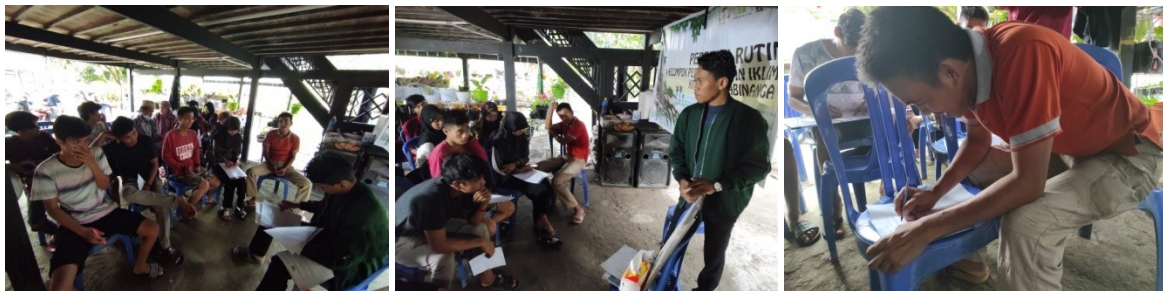
(Dokumentasi Pertemuan Rutin KPPI Binanga Saddang di Desa Bababinanga)

Umumnya, masing-masing donor memiliki format proposal tersendiri dalam setiap pengajuan proposal yang akan diajukan kepada donor. Namun dalam melaksanakan kegiatan yang tidak memiliki format, peserta dapat menggunakan format umum di atas untuk menjelaskan kegiatannya secara detail. Namun itu bukanlah format baku yang harus digunakan, pelaksana kegiatan juga bisa menambah atau mengurangi point di atas apabila dianggap perlu.