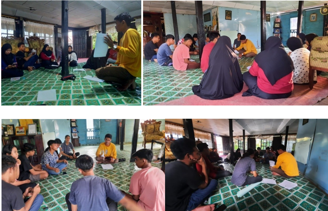
(Dokumentasi Pertemuan Rutin KPI PARMA di Desa Paria)

Kemudian dilanjutkan dengan Narasumber yang menjelaskan tentang materi RAB dan TOR. Rencana Anggaran Biaya, didefinisikan sebagai perkiraan perhitungan atas banyaknya biaya yang diperlukan untuk bahan, alat dan upah serta biaya-biaya lainnya yang berhubungan dengan pelaksanaan suatu pekerjaan atau kegiatan. RAB dibuat dengan memberi daftar biaya pada tiap pengadaan untuk menunjang pelaksanaan kegiatan.