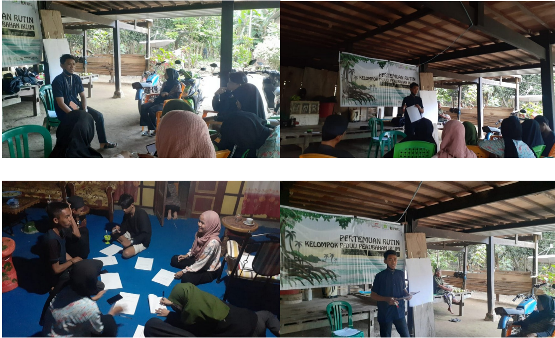
(Dokumentasi Pertemuan Rutin KPPI Biring Saddang di Desa Salipolo)

Setelah pemberian materi peserta di arahkan untuk membentuk 4 kelompok dimana masing masing kelompok diminta untuk membuat satu proposal kegiatan. Kegiatan yang dibuat adalah proposal untuk rencana kegiatan yang akan direalisasikan baik tahun ini maupun tahun depan, proposal yang akan dibuat akan dilakukan pendampingan untuk mencari anggaran sehingga anggota KPPI bisa menyelenggarakan kegiatannya secara mandiri. Proposal yang dibuat mengikuti format proposal yang diberikan oleh pemateri dimana pembuatan proposal dan didampingi oleh pendamping desa salipolo dalam pembuatannya.