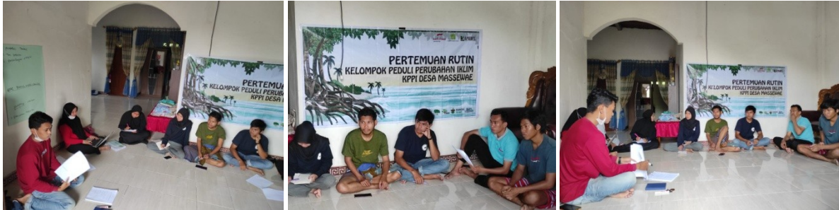
(Dokumentasi Pertemuan Rutin KPPI MAPIA di Desa Massewae)

Selanjutnya proposal harus memiliki luaran yang jelas dan terukur serta memberi dampak yang luas baik bagi penerima manfaat maupun pihak donor. Terkadang dalam pembuatan proposal kelompok membuat luaran yang sulit dicapai atau hanya menguntungkan salah satu pihak saja sehingga kemungkinan proposal untuk diterima sangat rendah.