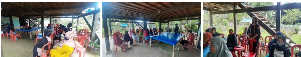
(Pertemuan di Desa Salipolo)

Penguatan Kelompok rentan atau Home Industri di Desa Salipolo dilaksanakan pada tanggal 18 Agustus 2021, Tepatnya di Dusun Salipolo, (Rumah Warga). Pada pertemuan ini dihadiri oleh Program Manager (PM), Program Officer (PO), Field Officer (FO) Desa Salipolo dan Warga anggota Kelompok Home Industri sebanyak 18 Orang dari 20 orang yang diundang.