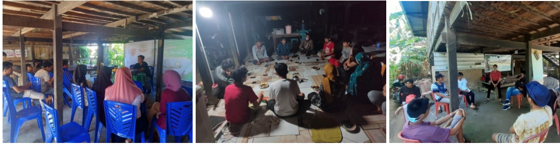
(Dokumentasi Evaluasi dan Kawasan Pembibitan Desa Paria, Desa Bababinanga dan Desa Salipolo)

Evaluasi yang dilaksanakan di Desa Bababinanga dilaksanakan di Desa Bababinanga telah dilaksanakan sebanyak 2 kali yaitu pada tanggal 21 dan 23 Agustus 2021. Secara umum pertumbuhan bibit mangrove di Nursery desa Bababinanga sangat baik, pertumbuhan merata dan kondisi bibit sangat bagus, tidak ditemukan hama pengganggu pada kawasan pembibitan. Namun yang menjadi catatan penting bagi PMU hilir adalah kawasan pembibitan mangrove saat ini masih dibayangi dengan aktifitas alih fungsi mangrove yang terjadi disekitar kawasan pembibitan sehingga dikhawatirkan apabila monitoring tidak rutin dilakukan maka bibit akan dirusak oleh oknum yang tidak bertanggungjawab sehingga KPPI harus memiliki kepedulian lebih untuk mengawasi kawasan tersebut dan menjaga keberlanjutan kawasan pembibitan mangrove yang telah dibuat.