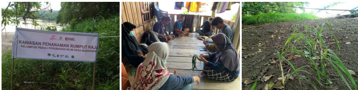
(Dokumentasi Evaluasi Hasil Monitoring Rumput Raja)

Evaluasi yang dilaksanakan di Desa Bababinanga dilaksanakan di Desa Bababinanga telah dilaksanakan sebanyak 2 kali yaitu pada tanggal 21 dan 23 Agustus 2021. Secara umum pertumbuhan bibit mangrove di Nursery desa Bababinanga sangat baik, pertumbuhan merata dan kondisi bibit sangat bagus, tidak ditemukan hama pengganggu pada kawasan pembibitan. Namun yang menjadi catatan penting bagi PMU hilir adalah kawasan pembibitan mangrove saat ini masih dibayangi dengan aktifitas alih fungsi mangrove yang terjadi disekitar kawasan pembibitan sehingga dikhawatirkan apabila monitoring tidak rutin dilakukan maka bibit akan dirusak oleh oknum yang tidak bertanggungjawab sehingga KPPI harus memiliki kepedulian lebih untuk mengawasi kawasan tersebut dan menjaga keberlanjutan kawasan pembibitan mangrove yang telah dibuat.