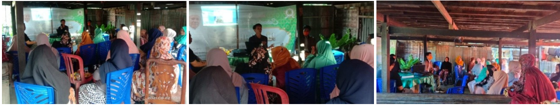
(Pertemuan di Desa Paria)

Penguatan Kelompok rentan atau Home Industri di Desa Bababinanga dilaksanakan pada tanggal 23 Agustus 2021, Tepatnya di Dusun Babana, (Rumah Warga). Pada pertemuan ini dihadiri oleh Program Manager (PM), Field Officer (FO) Desa Bababinanga dan Warga anggota Kelompok Home Industri sebanyak 20 Orang dari 20 orang yang diundang.