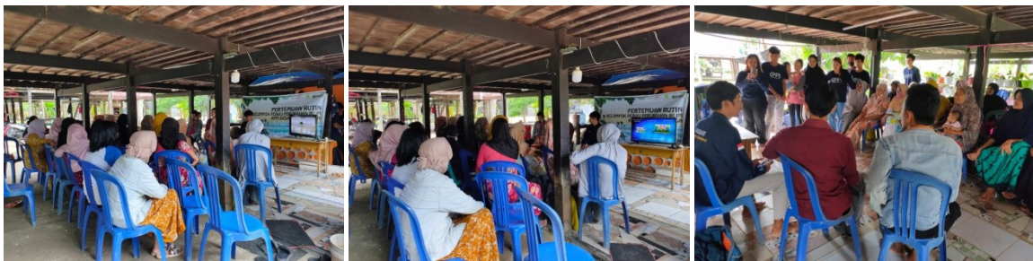
(Pertemuan di Desa Bababinanga)

Penguatan Kelompok rentan atau Home Industri di Desa Bababinanga dilaksanakan pada tanggal 23 Agustus 2021, Tepatnya di Dusun Babana, (Rumah Warga). Pada pertemuan ini dihadiri oleh Program Manager (PM), Field Officer (FO) Desa Bababinanga dan Warga anggota Kelompok Home Industri sebanyak 20 Orang dari 20 orang yang diundang.