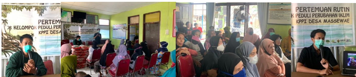
(Pertemuan di Desa Massewae)

Penguatan Kelompok rentan atau Home Industri di Desa Massewae dilaksanakan pada tanggal 21 Agustus 2021, Tepatnya di Kantor Desa Massewae. Pada pertemuan ini dihadiri oleh Program Manager (PM), Field Officer (FO) Desa Massewae dan Warga anggota Kelompok Home Industri sebanyak 18 Orang dari 20 orang yang diundang.