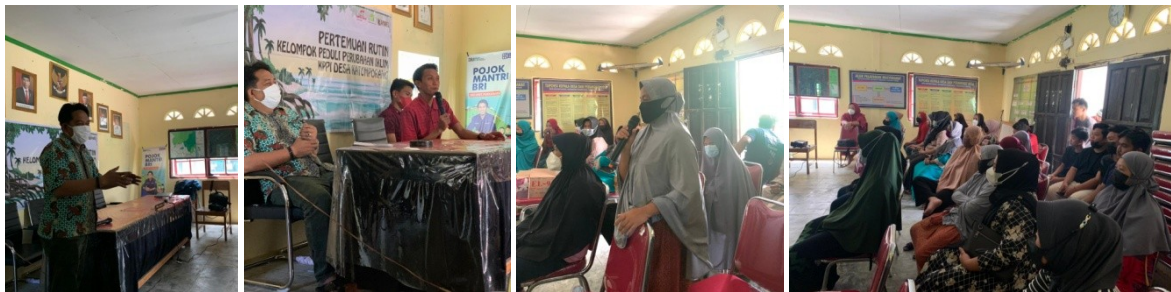
(Pertemuan di Desa Katomporang)

Penguatan Kelompok rentan atau Home Industri di Desa Katomporang dilaksanakan pada tanggal 19 Agustus 2021, Tepatnya di Kantor Desa Katomporang. Pada pertemuan ini dihadiri oleh Program Manager (PM), Field Officer (FO) Desa Katomporang dan Warga anggota Kelompok Home Industri sebanyak 20 Orang dari 20 orang yang diundang dan turut hadir juga kepala desa katomporang.